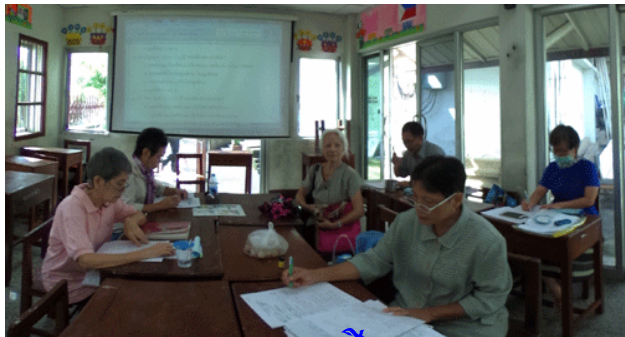
บรรยากาศการเรียนการสอน