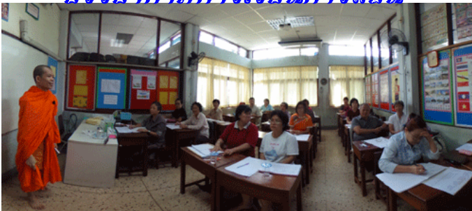
บรรยากาศการสอบพระอภิธรรม